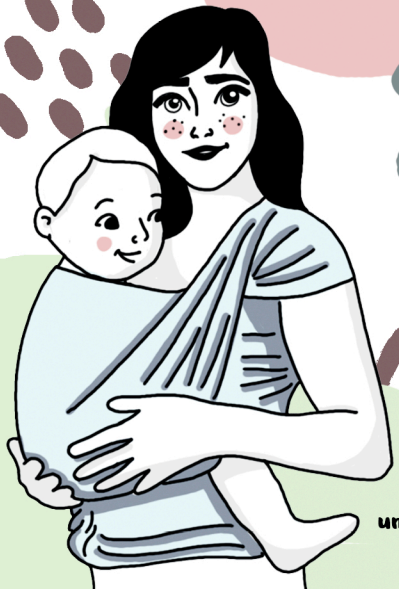
petit plus : une écharpe de portage

POUR NOUS CONTACTER : https://www.amkpl.fr